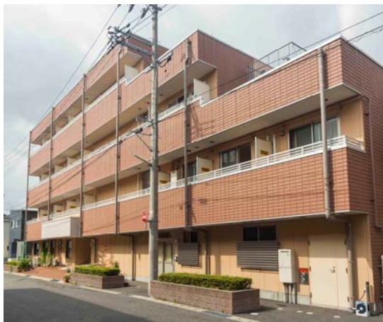
さわやかリバーサイド栗の木

Nippon Healthcare Investment Corporation