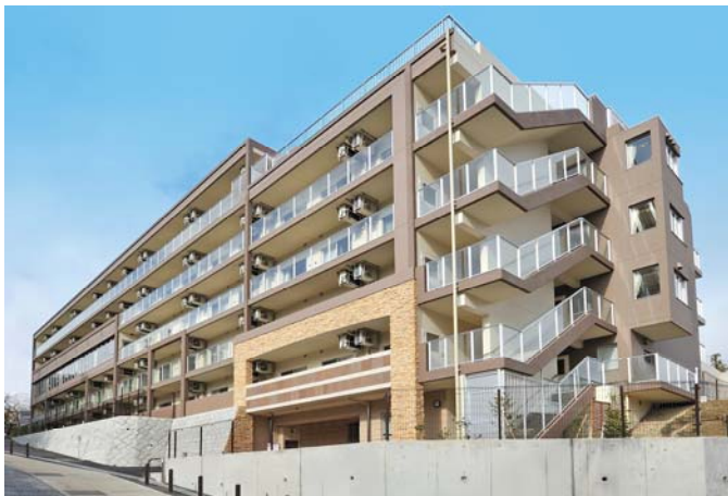
レストヴィラ衣笠山公園